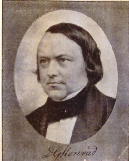
Grundlovens Forfatter og Fader, D. G. Monrad.

Den 4. April 1848 udstedte Kongen et Kgl. Reskript, som gav den kongelige Rigsforsamling den fulde Frihed til at vælge den grundlovgivende Rigsforsamling.