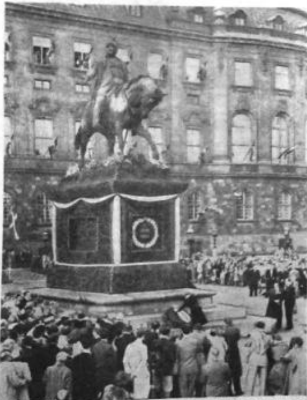
Grundlovens 100-Aarsjubilmum blev en af de største Festligheder, der nogensinde er afholdt i København. Dagens Række af Festligheder blev indledt med Kronspædledning af Kong Frederik ved Grundlovens Givers Statue udenfor Rigsdagen. Billedet viser Kongen ved Statuen af Frederik VII.

arrangeret smagfulde og storeleende Grundlovsudstillinger. Friluftsarran-gerementerne havde samlet store Menne-skemængder, lige fra Kransspædledningen ved Frederik den Syvendes